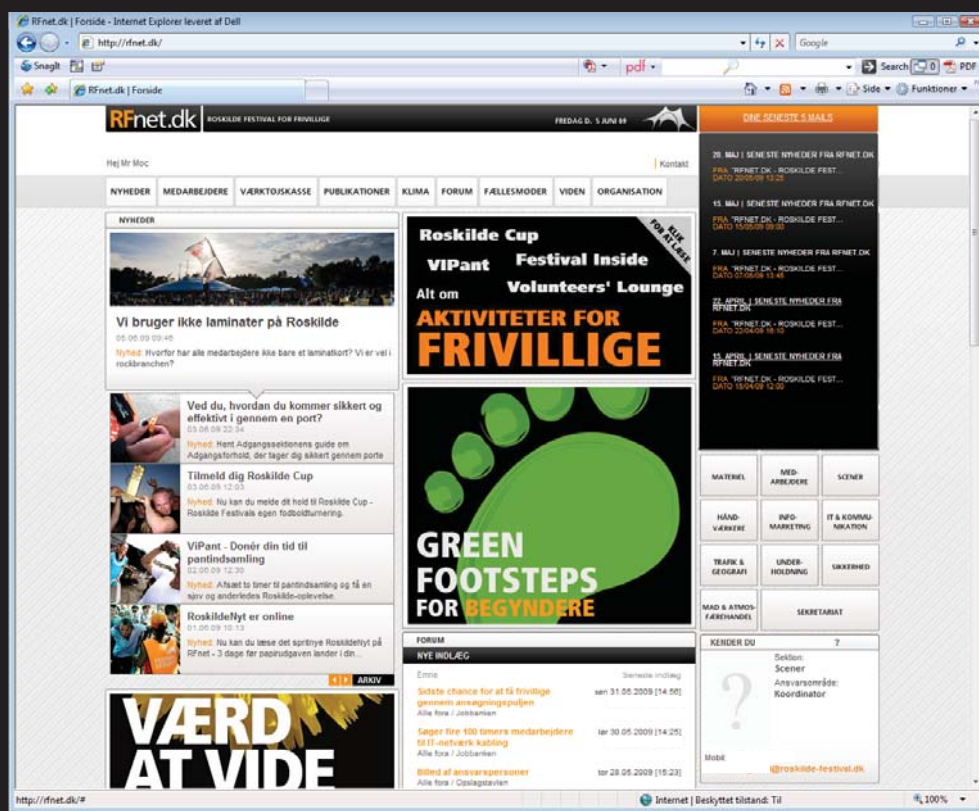
forside med mailboks åben

bog og organisationsstruktur på RFnet.dk. Alt sammen for at lette administrationen af brugere, og for at sikre en ensartet tilgang til kontaktoplysninger på - og for - RF's helårsfrivillige. Løsningen indholder desuden en række ting som er udviklet for at kæde organisationen sammen på tværs af sektionerne, disse bygger i høj grad på kommunikative og tekniske koncepter som ofte refereres til som Web 2.0.